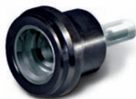
Adaptateur monocanal pour pipettes sans pointe