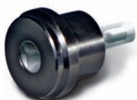
Adaptateur monocanal pour pipettes avec pointe