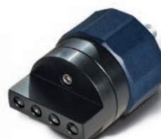
Adaptateur multicanaux pour pipettes avec et sans pointe