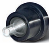
Filtre PE dans adaptateurs monocanal et multicanaux