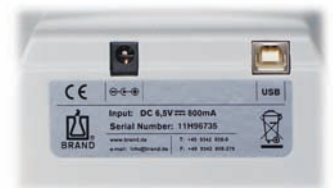
Dos de l'appareil avec prise d'alimentation et port USB