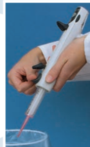
Espulsione del puntale

Basta premere il tasto! Tasto di espulsione ergonomico per eliminare i puntali contaminati in sicurezza senza toccarli.