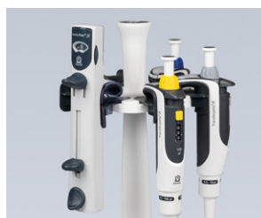
Der Regalhalter passt in den Tischständer für Transferpette®S.