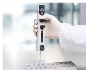
Dispensieren kleiner Volumina