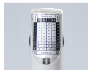
Schnelle Volumeneinstellung mit der Tabelle zu den Hubeinstellungen