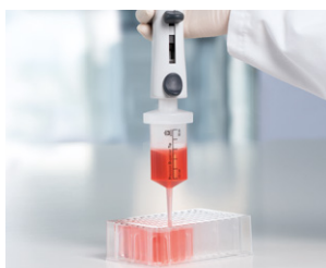
Distribution à répétition