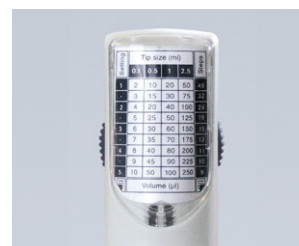
Réglage rapide du volume avec le tableau des réglages de course